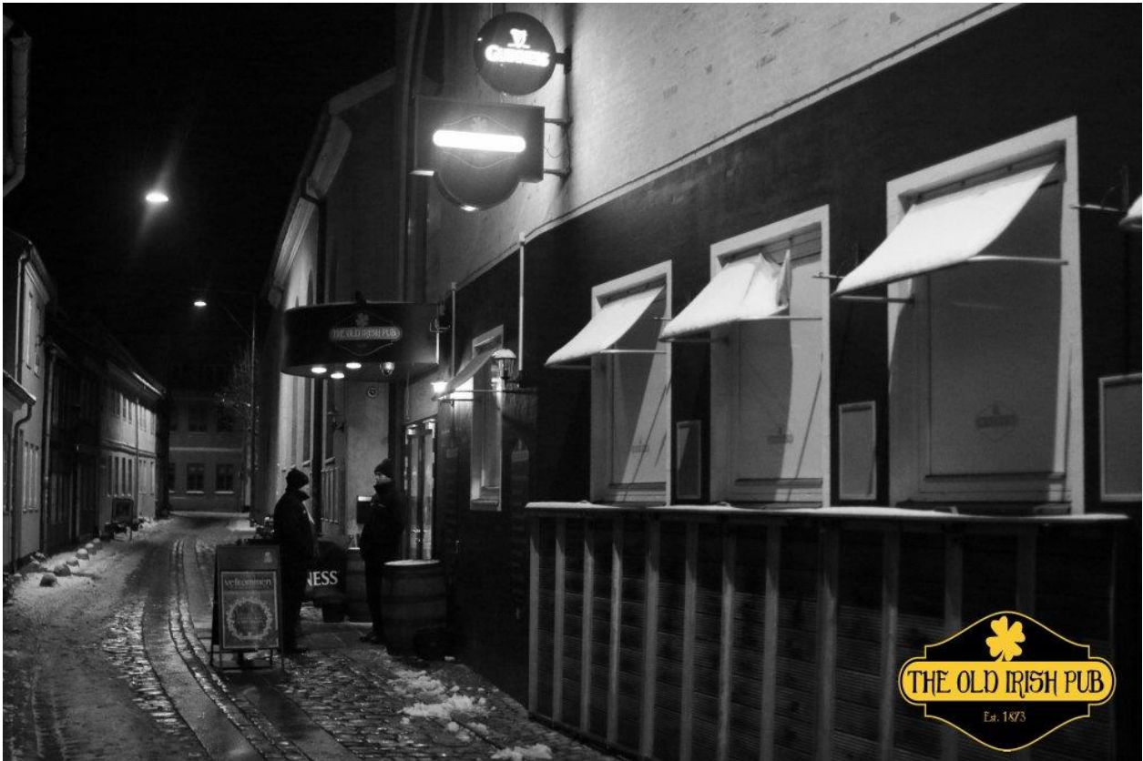
Old Irish Pub Søstræde 4. 3000 Helsingør.