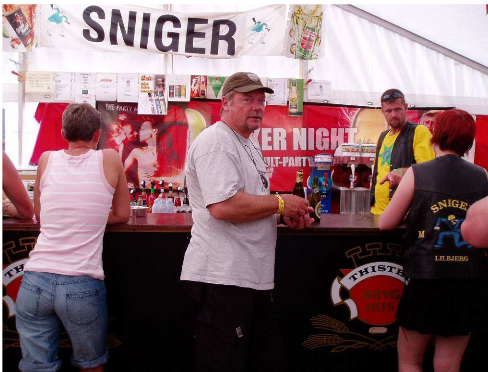
Mic får sig en sniger.