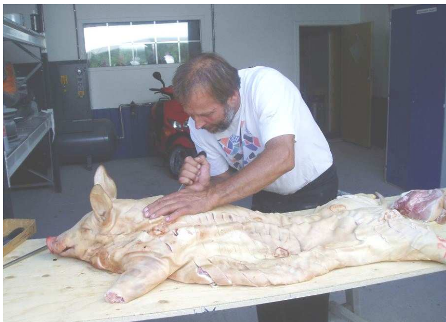
Per ridser svinet.