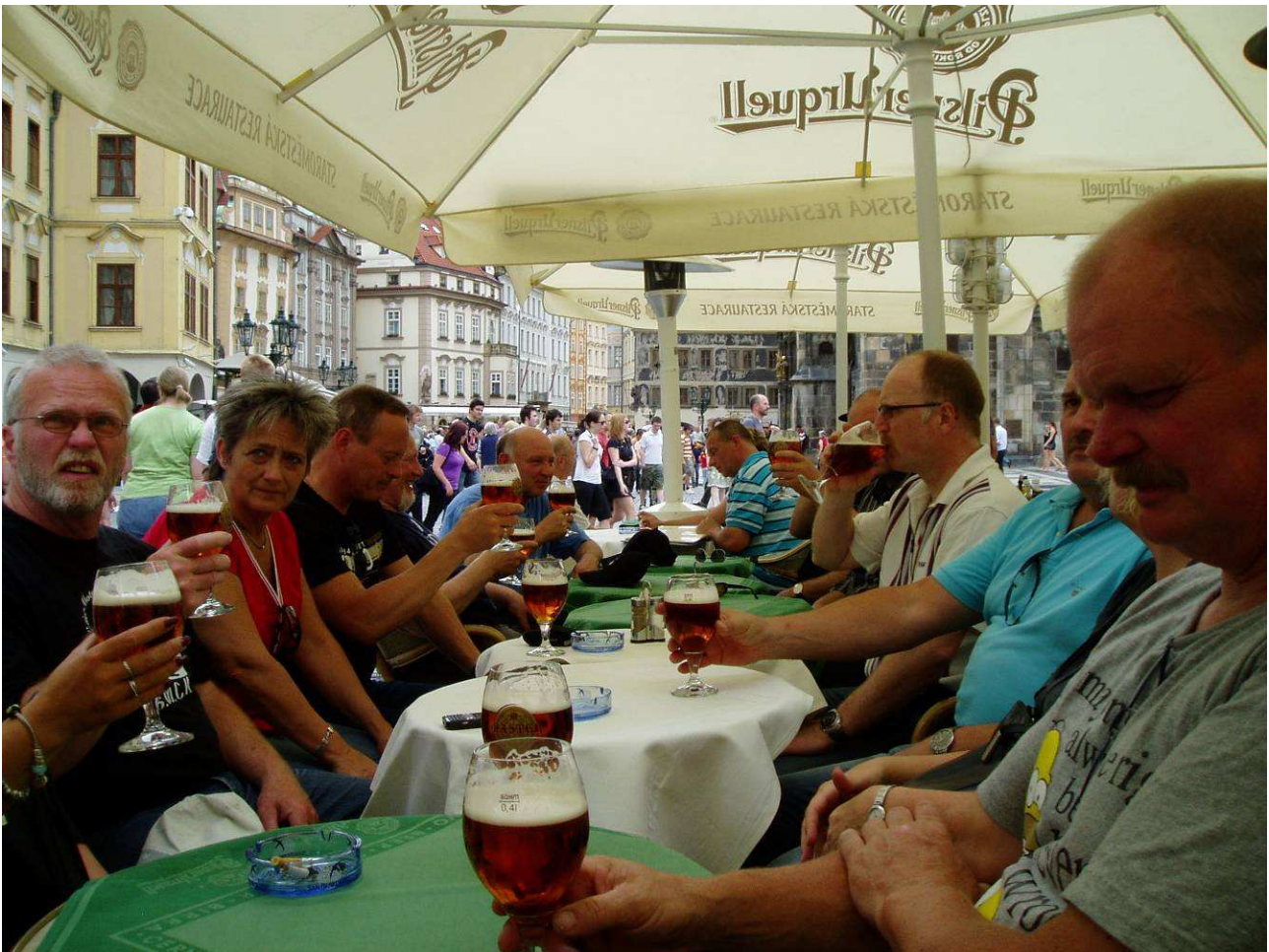
Stemnings billede fra torvet i Prag.