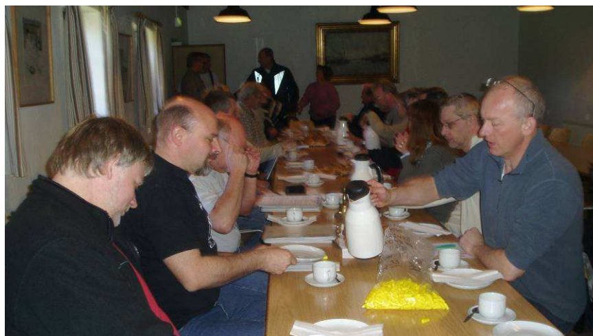
Billede fra vores generalforsamling.