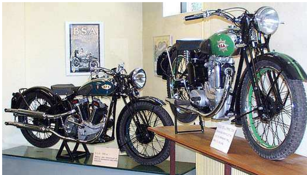
Udstillet MC'er fra Stubbekøbing museet.