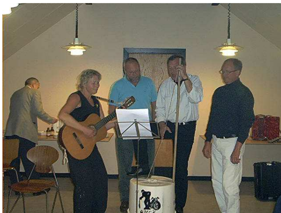
SMCK's husband optræder til afslutningsfesten.