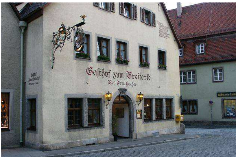
Første overnatning her i Rothenburg.