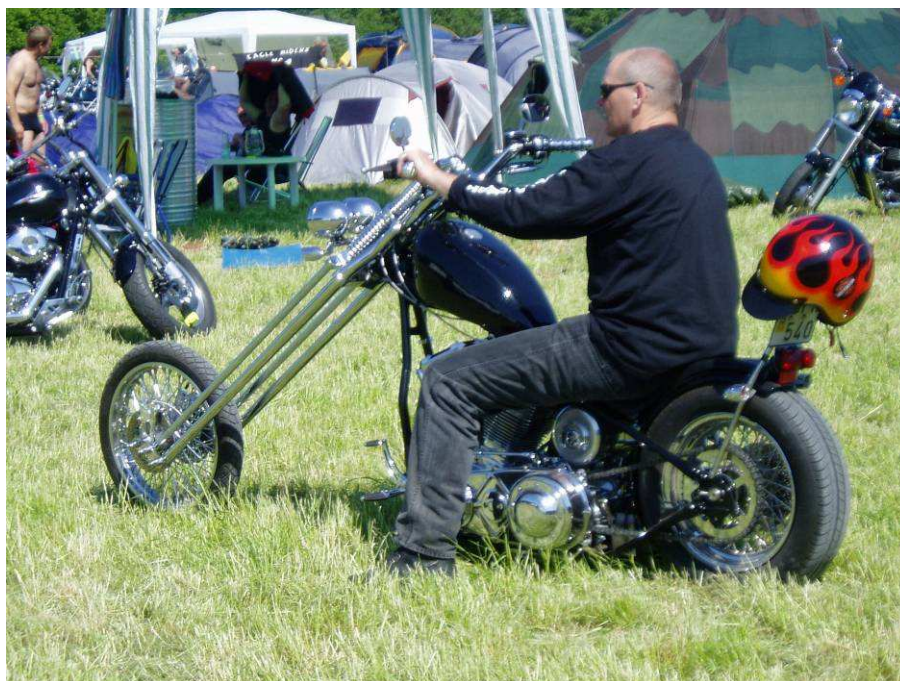
Maskine med forlænget forgaffel fra 777 træf.

Lørdag d. 28. oktober: Afslutningstur og fest, mere herom senere.